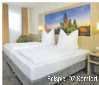
Beispiel DZ Komfort

DZ STD = Doppelzimmer Standard DZ KOM = Doppelzimmer Komfort Einzelzimmerzuschlag Saison 1: 15 €/N. Saison 2+3: 33 €/Nacht Kurtaxe: ca. 0,50 € pro Person/Nacht Auch 5 Nächte buchbar!