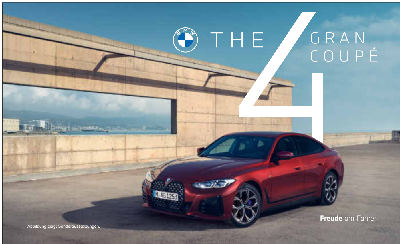
Abbildung zeigt Sonderausstattungen.