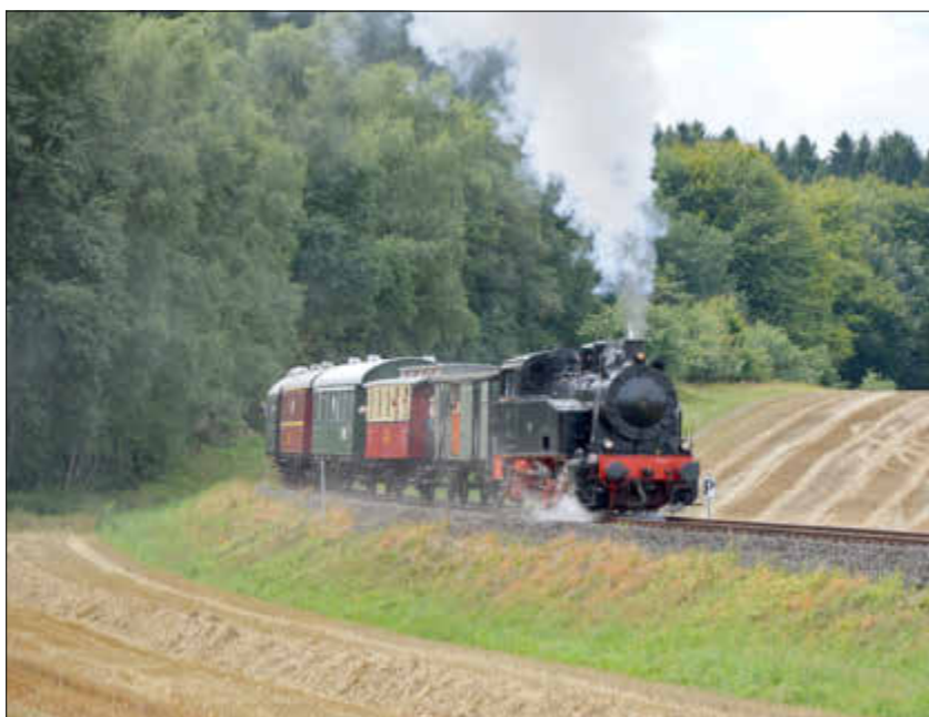
Derzeit werden die Eisenbahnschienen lediglich für die Fahrten der Museumseisenbahn genutzt.

Wenn teure Fachgutachten über Jahrzehnte immer wieder zum selben Ergebnis kommen und eine verkehrstechnische, wirtschaftliche und ökologische Unsinnigkeit attestieren und wenn namhafte Organisationen wie Bundesverkehrsministerium, Umweltministerium, BUND, NABU, VCD, ADFC, VJS u.v.a. nur als Verhinderer dargestellt werden, statt diese als Ideengeber ernst zu nehmen, dann ist dieses politische Verhalten meines Erachtens nicht zielführend.