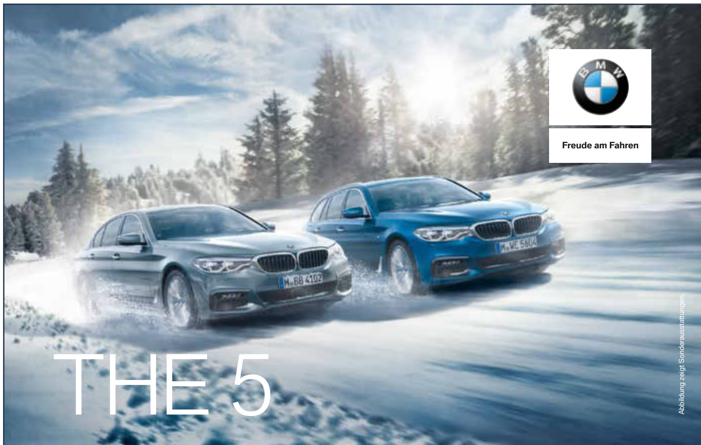
Abbildung zeigt Sonderausstattungen.