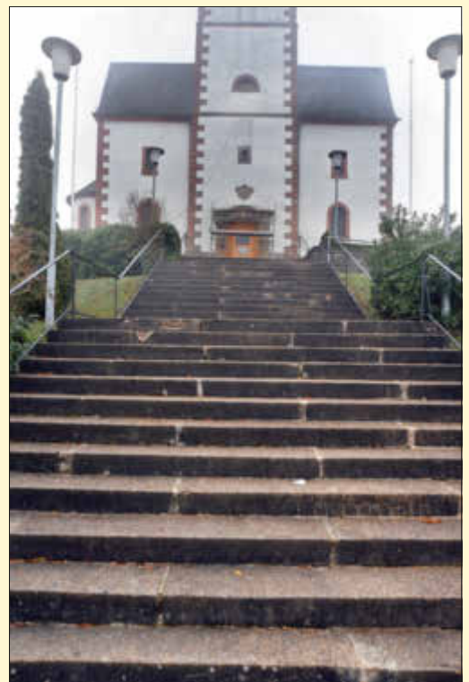
Die marode Kirchentreppe in Wahlen