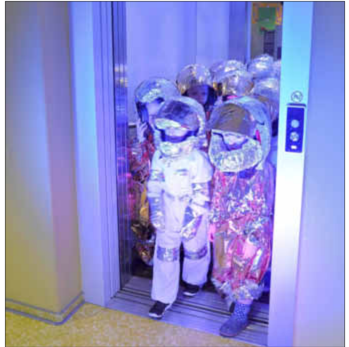
und los geht's ...