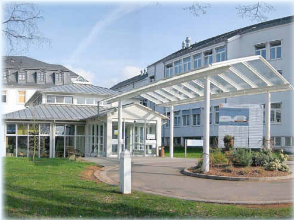
Marienhausklinik St. Josef Losheim am See