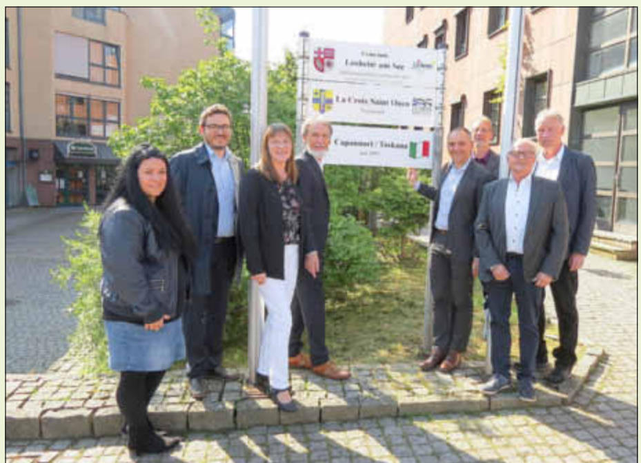
Festliche Enthüllung des Partnerschaftsschildes