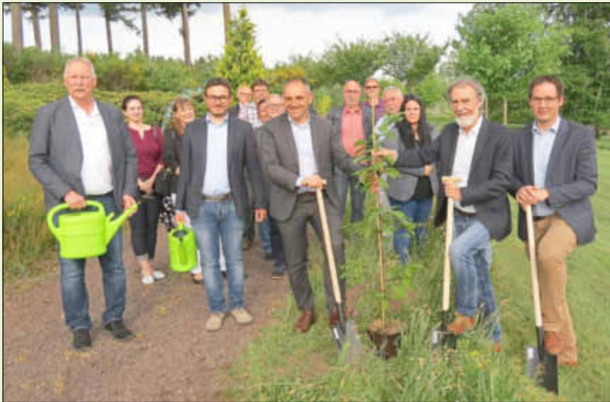
Gelungene Pflanzaktion des Partnerschaftsbaumes im SeeGarten mit zahlreichen Gästen

Mit dem Besuch des Baumwipfelpfades in Orscholz mit beeindruckendem Blick auf das Wahrzeichen des Saarlandes, der Saarschleife, erhielt der Austausch einen gelungenen Abschluss und ließ Vorfreude auf den Gegenbesuch der deutschen Delegation aufkommen, die im August dieses Jahres zum Jubiläumstreffen nach Capannori reisen wird.