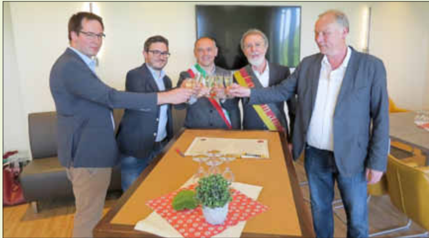
Ein Prost auf die Unterzeichnung der Partnerschaftsurkunde