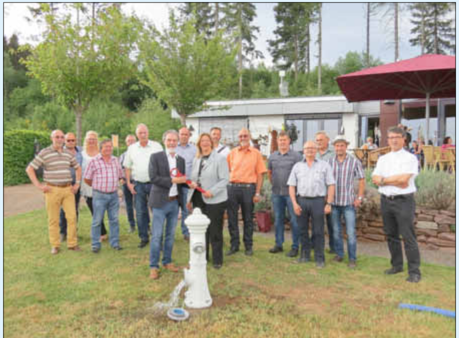
Inbetriebnahme der neuen Quelleitung des „Metzerbaches“ zur Saisonöffnung 2018

Anschließend stieß man sowohl auf eine erfolgreiche und besucherstarke Stauseesaison als auch auf eine künftige gute Zusammenarbeit mit der DLRG in ihrem neuen Domizil an.