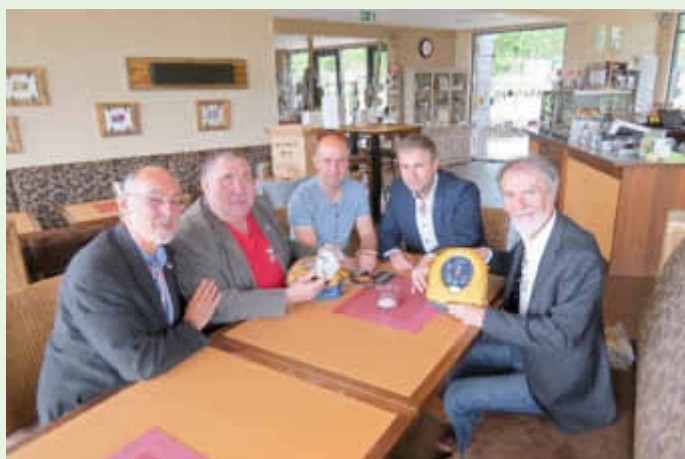
Darstellung der einfachen Handhabung des sprachgesteuerten Defibrillators

Weitere Informationen zur Kampagne HerzGesund und aktuelle Termine unter: www.HerzGesund-Saarland.de und www.herzensengel.de