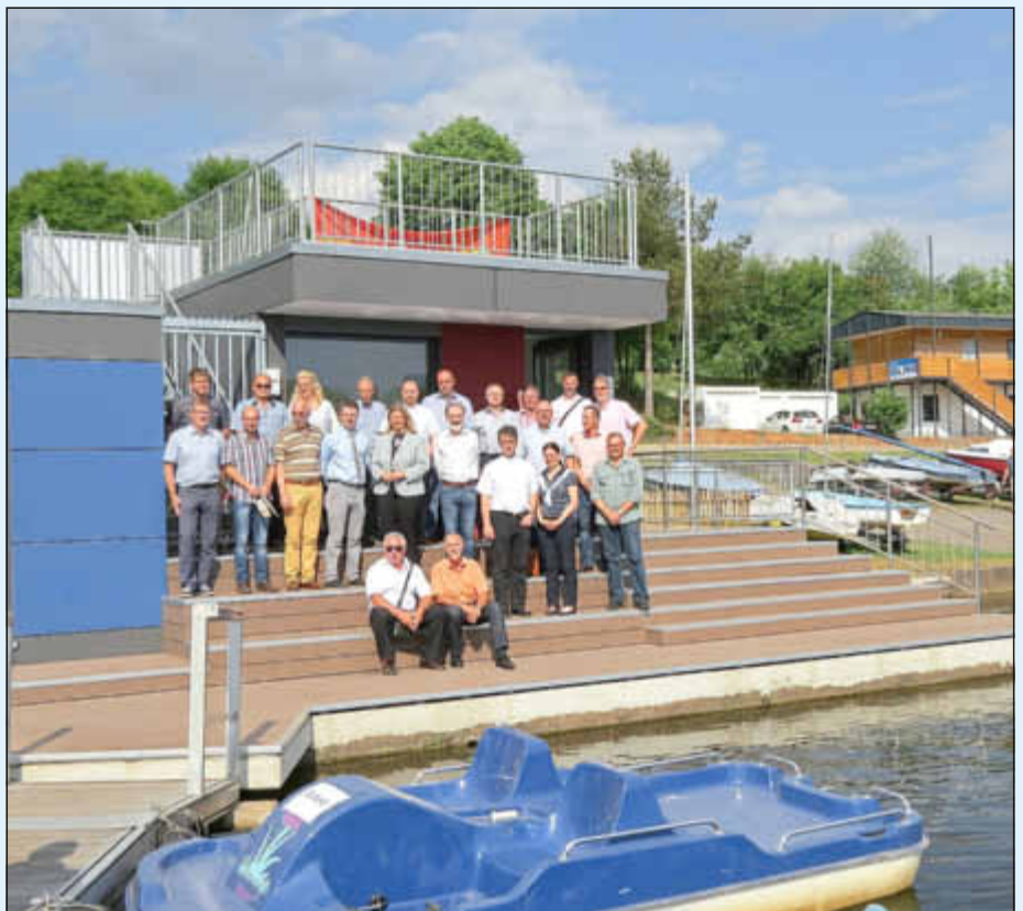
Neue DLRG-Rettungswacht direkt am Stausee

So hat man im vergangenen Jahr auch den nach über 40 Jahren stark sanierungsbedürftigen Tretbootverleih durch ein neues modernisiertes Gebäude mit Dachbegrünung ersetzt. Zudem lädt ein neuer Bootsverleih mit Kiosk und