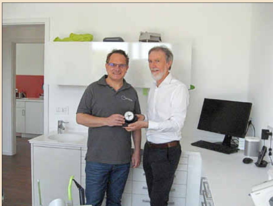
Bürgermeister Lothar Christ (rechts) zu Besuch in den neuen Räumlichkeiten

Durch dieses Projekt ist es der Gemeinde in Zusammenarbeit mit dem Investor gelungen, städtebaulich die Weiskirchenerstrasse aufzuwerten.