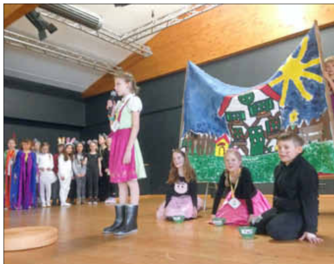
Theaterspiel über eine Maus und einen Kater.