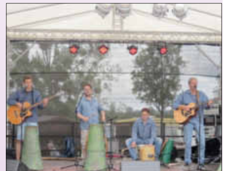
Die Wéngert-Stompers in Aktion