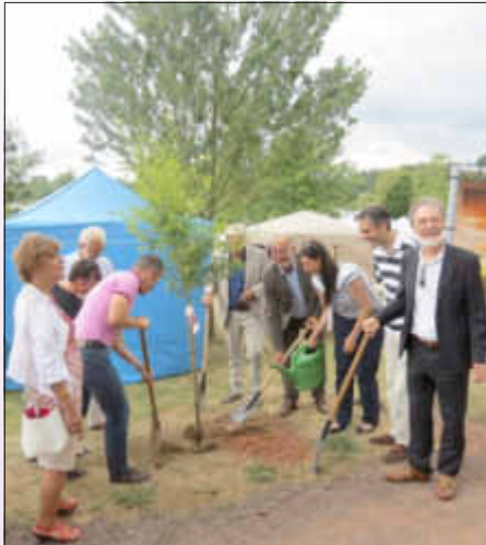
Der Partnerschaftsbaum ist gepflanzt!

Als Ausrichter des diesjährigen GEPACO-TAGES , der jährlich in einer anderen der fünf Mitgliedsgemeinden des grenzüberschreitenden Netzwerks in der Großregion veranstaltet wird, hatte die Gemeinde Losheim am See im Rahmen der Messe „Garten- und Genuss“ in den SeeGarten eingeladen.