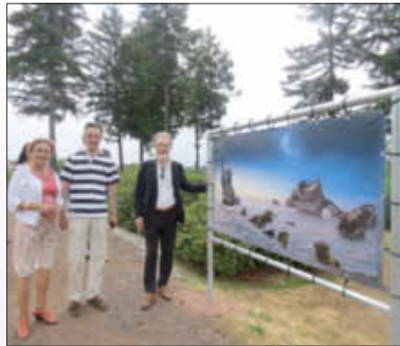
Rundgang durch die Ausstellung „Welten der Zukunft“

Integriert in das besondere Bürgerevent war zudem die offizielle Eröffnung der Dauer-Ausstellung „Welten der Zukunft“, der neben Gästen aus den Gepaco-Partnerstädten Strassen (Lux.), Montigny-lès-Metz (F), Habay (B) und Konz (Rh.-Pf.) sowie dem Verfasser der Ausstellung, Yannik Monget, auch der Staatssekretär im saarländischen Umweltministerium, Roland Krämer, in Vertretung für den Umweltminister beiwohnte. Darüber hinaus waren auch der Erste Kreisbeigeordnete und Landtagsabgeordnete Frank Wagner sowie weitere Vertreter der Landes- und Kommunalpolitik, der Schulen und regionalen Institutionen in der Gästerunde vertreten.