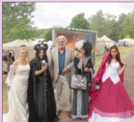
Cosplay-Modells aus Habay mit dem Strassener Bürgermeister

Für die Ausstellung wünschte sich der Bürgermeister viele interessierte Besucher und bedankte sich beim Umweltministerium und dem Landkreis für deren Förderung im Rahmen des europäischen LEADER-Projektes.